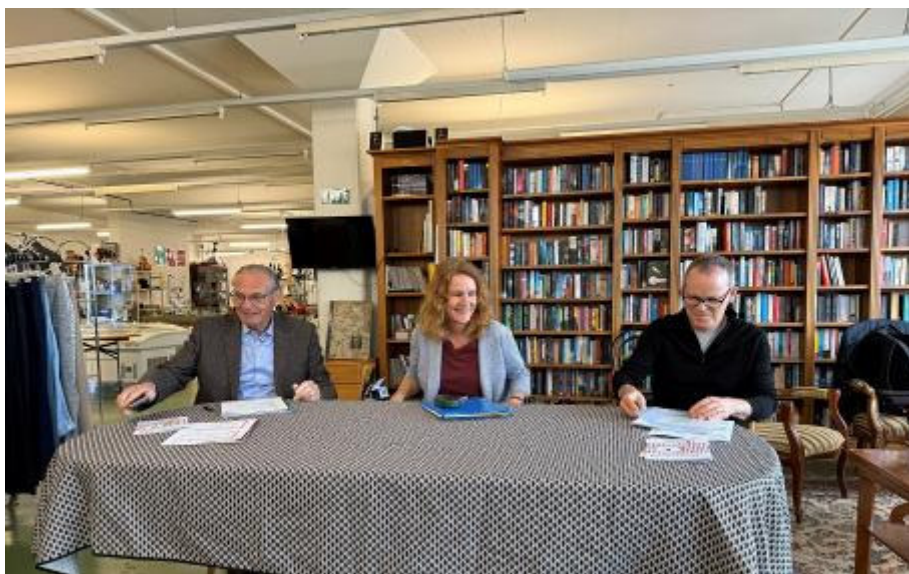
171. Jahresversammlung der GGB in der Brockenstube von Cartons du Coeur Baselland