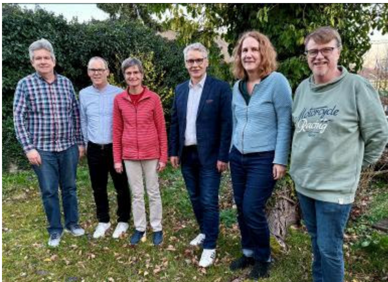
Vorstand der GGB 2025

Telefon 079 314 11 37 E-Mail info@ggb-baselland.ch Homepage www.ggb-baselland.ch Spendenkonto IBAN CH50 0900 0000 4000 7235 1